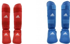
Protège-Tibias & Pieds Ju-Jitsu Rouge ou Bleu