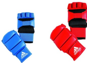
Gants de Ju-Jitsu Rouge ou Bleu